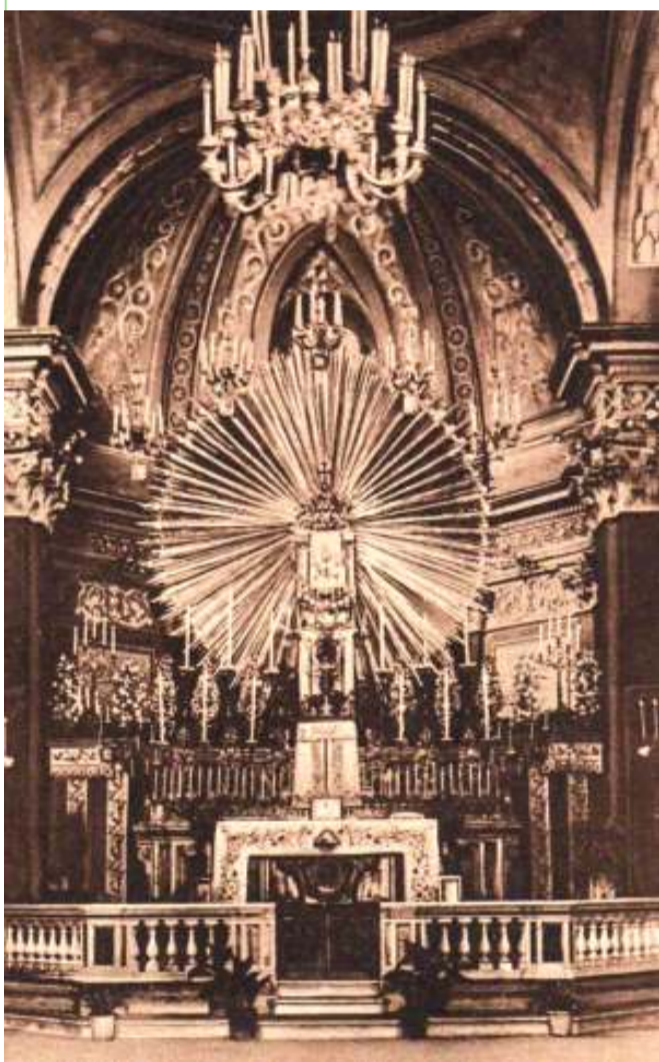
Chiesa di Santa Maria Maggiore

Un'importante ricorrenza segna quest'anno la tradizione della storia religiosa di Sant'Arsenio, difatti nel 1913 fu organizzato nel piccolo paese del Vallo di Diano, primo di numerosi altri,